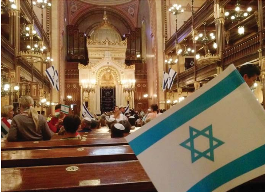
Israel mellett kiálló békés tüntetőkkel telt meg a budapesti Dohány zsinagóga