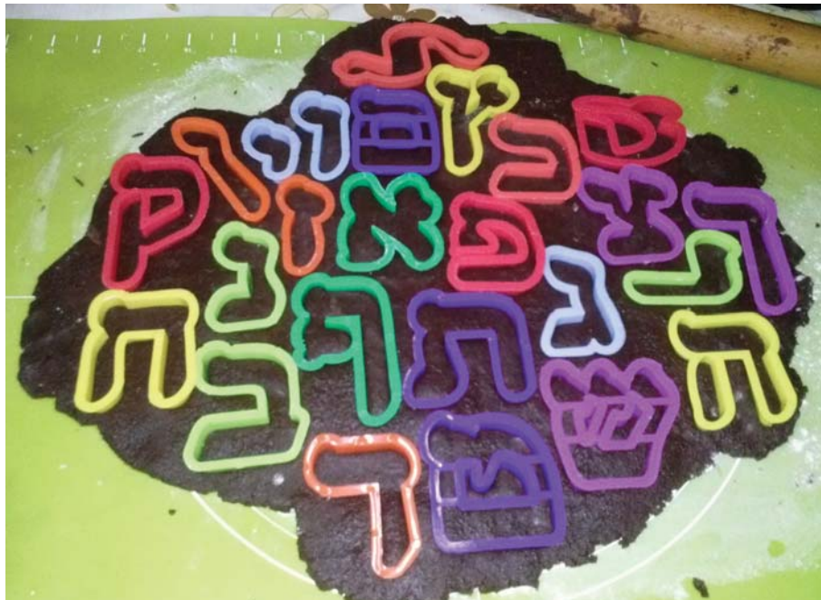
Vyučovanie hebrejčiny v Komárne pokračuje – info: kile@menhaz.sk