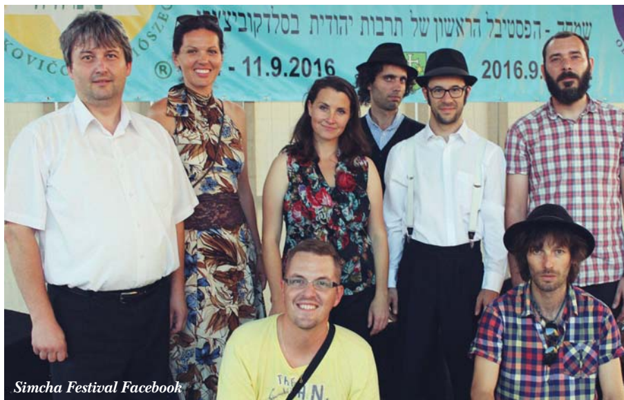
Simcha Festival Facebook