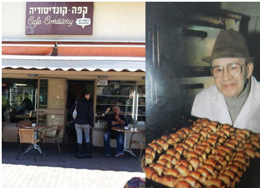
Sorozatunk első részében az izraeli Wilhelm cukrászda történetét mutatjuk be (3. oldal)