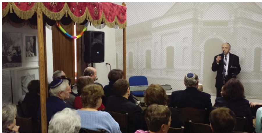
Purim 5775 Komáromban – bővebben márciusi számunkban