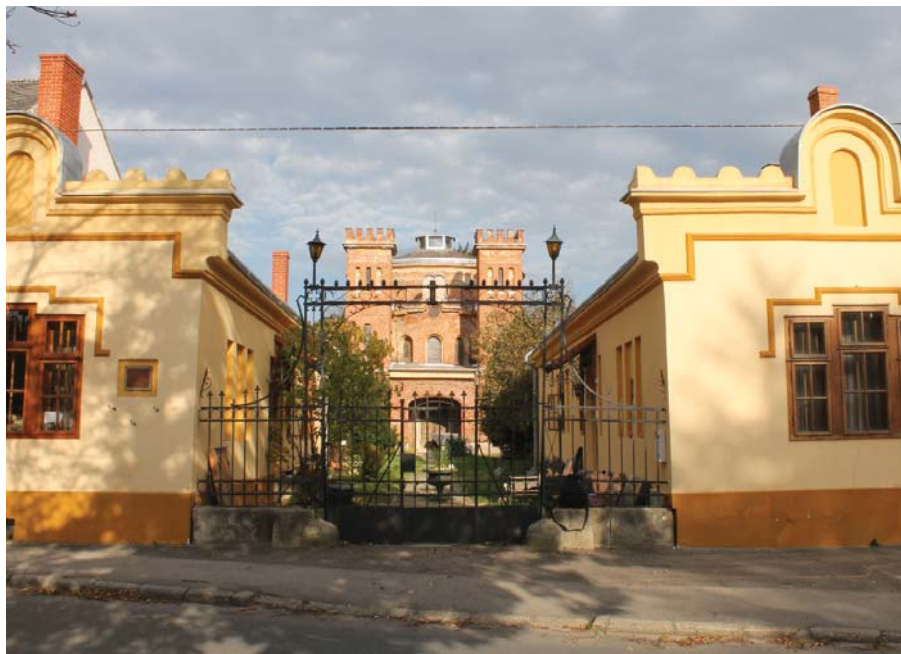
Hitközség alakult Kőszegen (részletek a 4. oldalon)