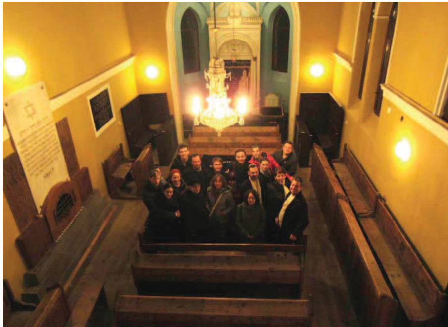
Slovenská únia židovskej mládeže usporiadala v Komárne jesenný seminár – (strana 3.)